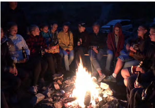
Lagerfeuerromantik beim Ausflug auf die SCA Hütte ins Moostal.