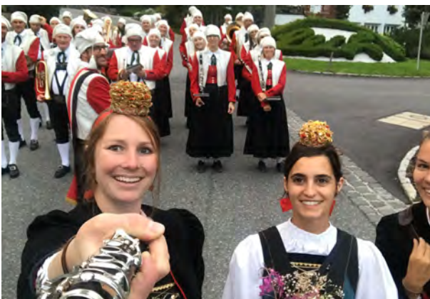
Marschauftellungselfie vor dem Abendkonzert

Bereits seit 2003 ist die Trachtenkapelle Lech fixer Bestandteil des Oktoberfestes in Beaver Creek. Am letzten Augustwochenende finden sich alljährlich tausende von Besuchern ein, um ein Fest zu zelebrieren, welches sich von „herkömmlichen“ Oktoberfesten sehr wesentlich unterscheidet. Es gibt kein Zelt, sondern der Biergarten ist draußen in der Natur vor der beeindruckenden Kulisse der Rocky Mountains. Österreichische Blasmusik gibt es in den USA selten live zu hören, deshalb kommen viele Besucher extra wegen der Konzerte der Trachtenkapelle.