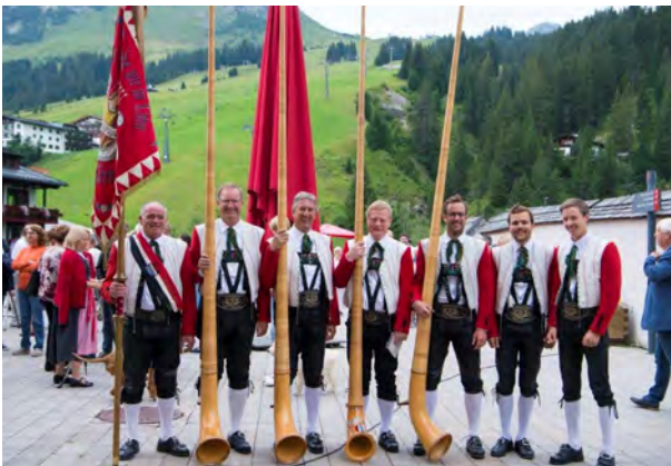
Die Abordnung der Trachtenkapelle Lech beim Zeitkapsselfest.