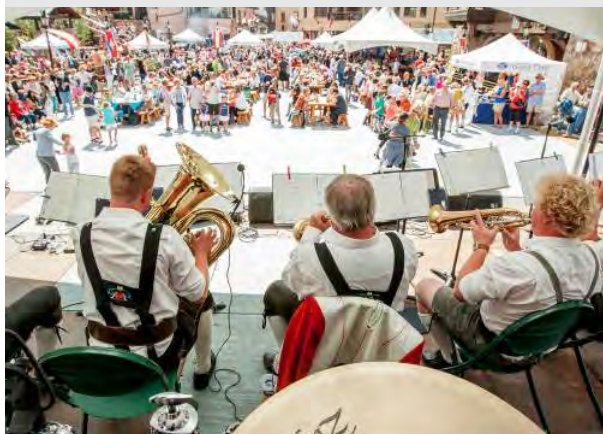
Die „Kleine Partie“ beim Oktoberfest in Beaver Creek 2018

stehen gehabt. Die Lecher Alphornbläser haben im letzten Jahr fünf Mal geprobt und sind 31 Mal ausgerückt. Highlights der auswärtigen Termine waren sicher das Arlberger Musikfest und die Jubiläumsfeierlichkeiten anlässlich des 800. Geburtstages von Klösterle und die musikalische Umrahmung des Oktoberfestes in Beaver Creek durch die kleine Partie, bei dem an zwei Tagen weit über 15.000 Besucher anwesend waren. Ebenfalls zu den besonderen Erlebnissen zählte der Ausflug im Herbst, welcher auf die SCA Hütte nach St. Anton am Arlberg führte. Die Anreise erfolgte per Mountainbike.